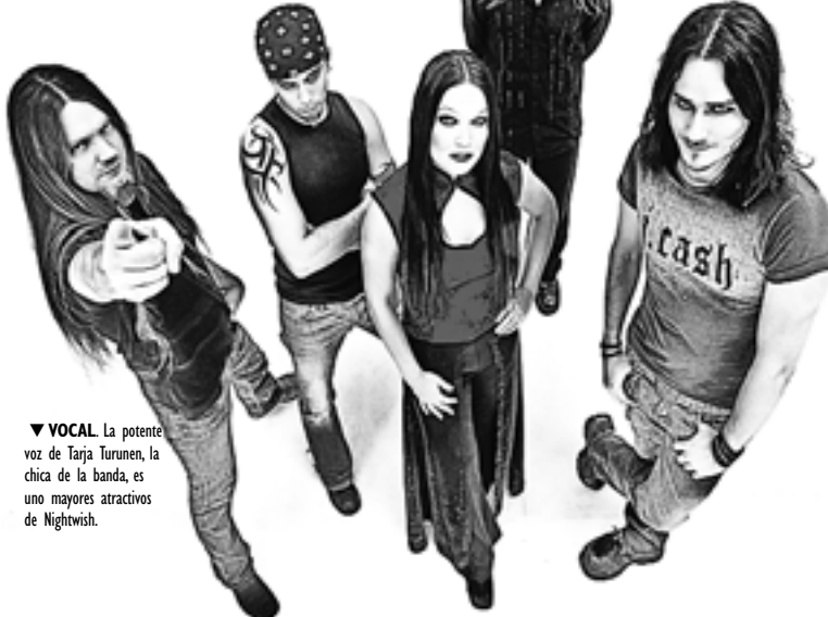
▼ VOCAL. La potente voz de Tarja Turunen, la chica de la banda, es uno mayores atractivos de Nightwish.