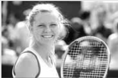
▼ Kirsten Dunst protagoniza esta comedia romántica ambientada en el mundo del tenis.