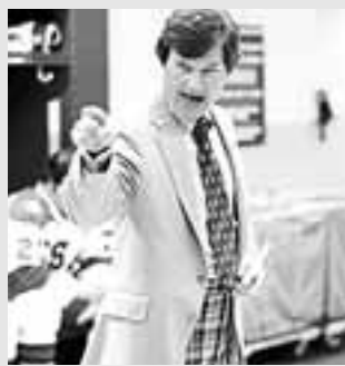
▼ Kurt Russell es el esforzado entrenador de 'El milagro'.