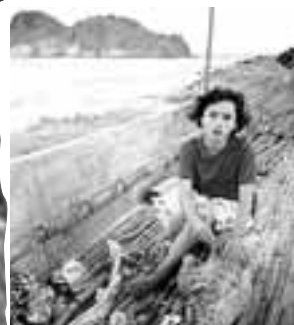
▼ La Pai responde a la llamada de las ballenas.