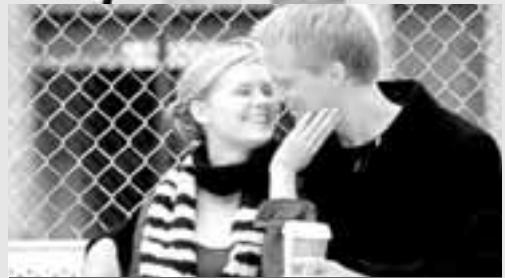
▼ Kirsten Dunst encarna a la tenista americana y Paul Bettany al tenista inglés.